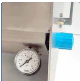
Das Vakuumniveau wird einfach durch einen Regler eingestellt