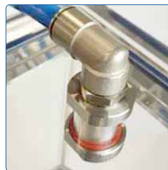
Guter Schutz vor mechanischer Belastung