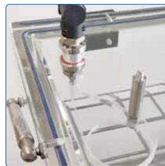
Schnelle und einfache Verbindung mit dem optionalen Vakuum-Set