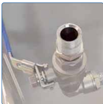
Einfacher Wasserablass per Kugelhahn