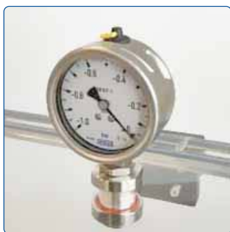
Die Vakuumkammer ist ausgelegt für den Betrieb bis zu -0,8 bar